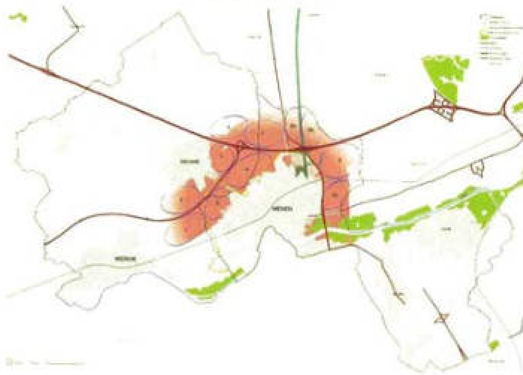
Figuur 1-57 aanduiding zoekgebied

Die "potentiele locaties" werden vervolgens onderworpen aan een aantal "afwegingscriteria":